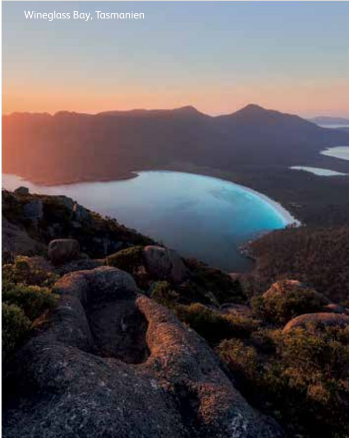
Wineglass Bay, Tasmanien