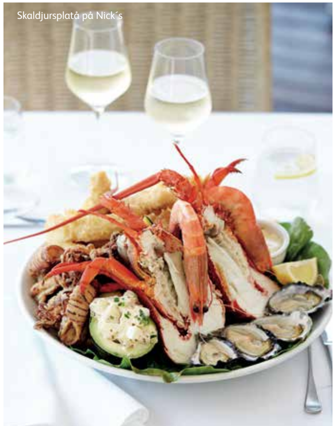
Skaldjursplåtå på Nick's

AUSTRALIEN – som ett av världens mest kontrastrika och fascinerande länder bjuder Australien på öknar, frodiga regnskogar, spännande storstäder och ett unikt djurliv. En ung nation på 200 år trots att här har funnits en civilisation och kultur i mer än 50 000 år. Australien måste upplevas!