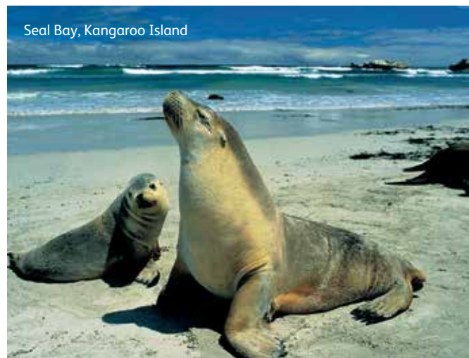
Seal Bay, Kangaroo Island