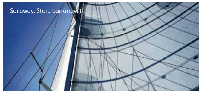
Sailaway, Stora barrärrevet

AUSTRALIEN – som ett av världens mest kontrastrika och fascinerande länder bjuder Australien på öknar, frodiga regnskogar, spännande storstäder och ett unikt djurliv. En ung nation på 200 år trots att här har funnits en civilisation och kultur i mer än 50 000 år. Australien måste upplevas!