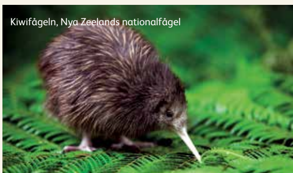
Kiwifågeln, Nya Zeelands nationalfågel