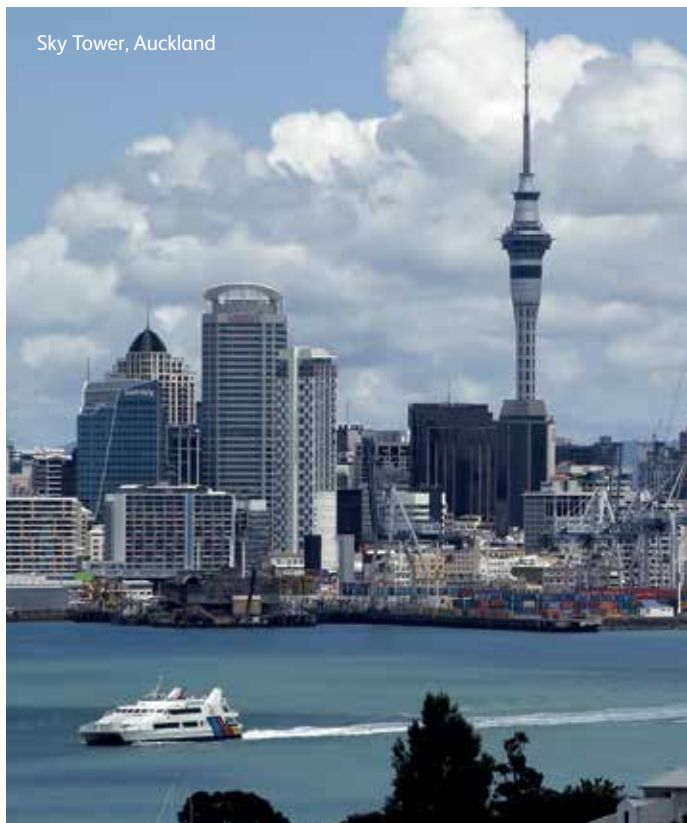
Sky Tower, Auckland